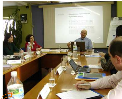
Un memento al participarii ISOB in timpul intalnirii