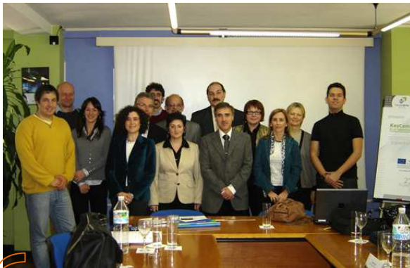
Familia Keycom Kit